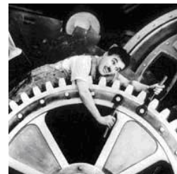
Charles Chaplin, no Filme Tempos Modernos

https://www.youtube.com/watch?v=3tL3E5flZis